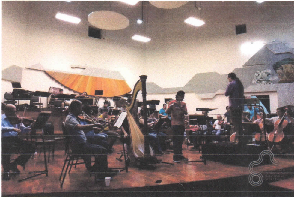
6. Participé en la presentación del III Concierto de Temporada Extraordinario, realizado el 16 de Agosto de 2018, en el Conservatorio Nacional de Música.